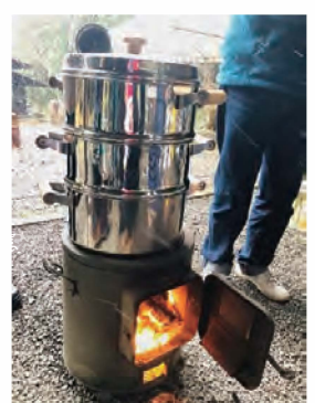
①持ち寄った餅米を蒸している写真