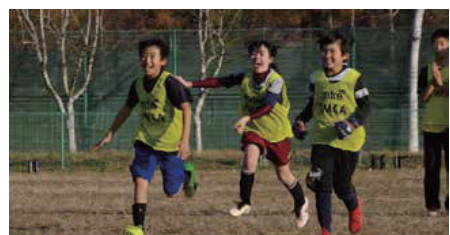
「仲間と共に心の底から喜び合っていて、なんかいいですね。」 11月3日(祝)岩手県立大学を会場に開催された、盛岡YMCAのサッカー大会「チャンピオンズカップ」高学年の部 準決勝PK戦のシーン