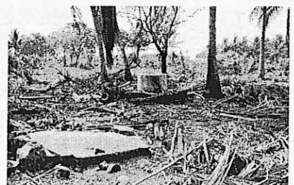
海岸付近の集落の様