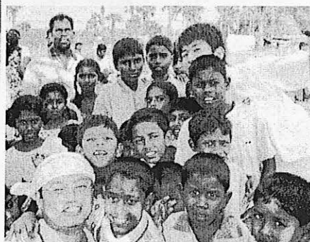
被災者キャンプの子ども達