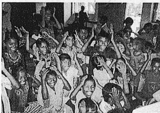
YMCAでのレクリエーション活動