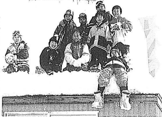
田沢湖は、雪が豊富でご覧のとおり、屋根の上にも平気で登れちゃいます。

参加者は、オープン参加の2名を含めて、全員で10名。当日は、雪祭りも行われていてムード満点。夜店で買い物をしたり、スキー以外にも十分楽しんで帰ってきました。